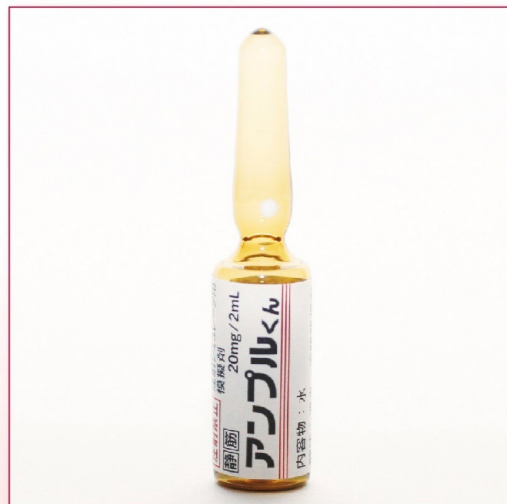
24-02 IKA-2(液体:水) 褐色アンプル 20mg/2mL 50本入 ¥10,400 (税別)