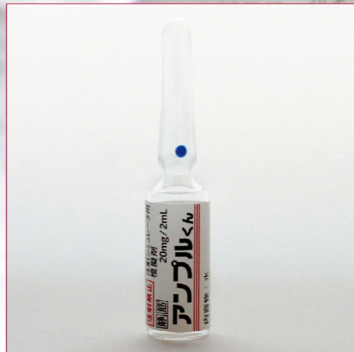
24-01 IKA-1(液体:水) 透明アンプル 20mg/2mL 50本入 ¥10,400 (税別)

本模擬剤は、シミュレータに悪影響のない水と粉末です（粉末模擬剤のみ、センサー付注射シミュレータには使用出来ません）。この水と粉末は無害ですが、人体への使用は厳禁です。指導者のもとに正しく使用と管理をお願い致します。