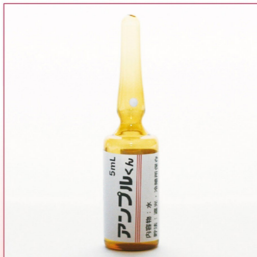
24-04 IKA-4(液体:水) 褐色アンプル 5mL 50本入 ¥10,400 (税別)