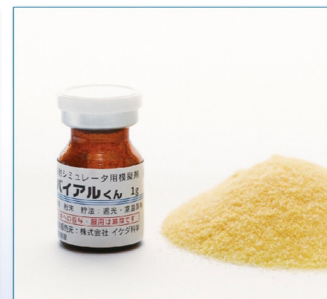
24-10 IKB-6(粉末:黄) 褐色バイアル 1g 50本入 ¥12,600 (税別)