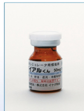
24-06 IKB-2(液体:水) 褐色バイアル50mg/5mL 50本入 ¥12,600 (税別)