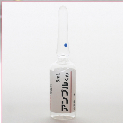
24-03 IKA-3(液体:水) 透明アンプル 5mL 50本入 ¥10,400 (税別)