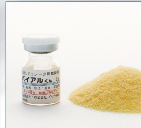
24-09 IKB-5(粉末:黄) 透明バイアル 1g 50本入 ¥12,600 (税別)