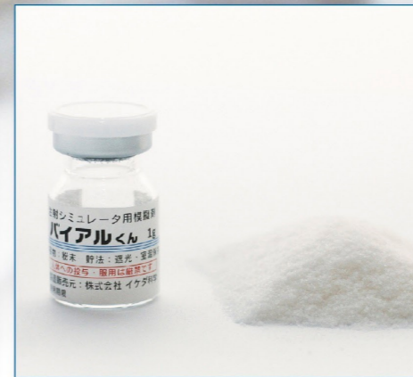
24-07 IKB-3(粉末:白) 透明バイアル 1g 50本入 ¥12,600 (税別)